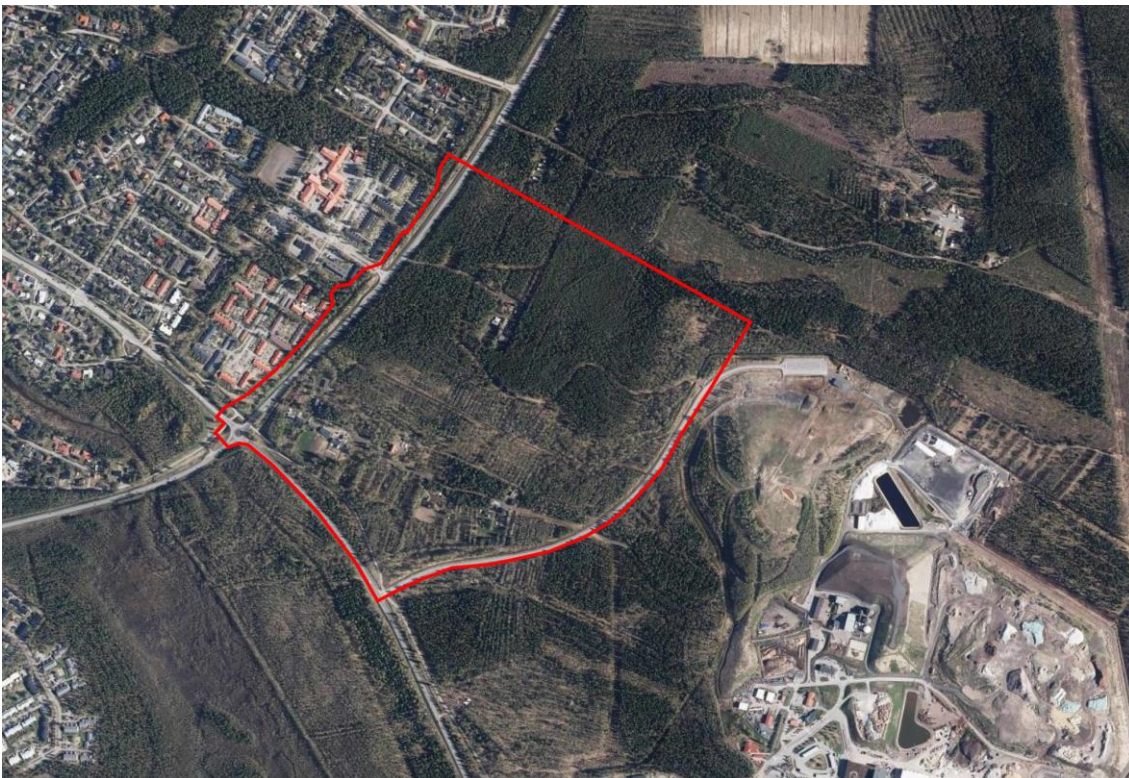
Kuva 2. Ilmakuvaan on rajattu punaisella alue, jolle suunnitellaan uutta asemakaavaa.

Asemakaavan tavoitteena on suunnitella alueen maankäyttöä Uuden Oulun yleiskaavan periaatteiden mukaisesti. Alueelle tavoitellaan monipuolista tonttitarjontaa pientalovaltaiselle asumiselle. Alueelle voi sijoittua omakotitaloja, kytkettyjä pientaloja, rivitaloja ja pienkerrostaloja. Lisäksi alueelle voi sijoittua jonkin verran palvelu- ja työpaikkarakentamista liittyen esimerkiksi urheilu- ja virkistyspalveluihin. Alueelle suunnitellaan toimiva ja tehokas katuverkko, sekä kehitetään alueen viheryhteyksiä ja virkistysmahdollisuuksia huomioiden alueen olevat ja tulevat ulkoilureitit sekä alueen luonto- ja maisema-arvot.